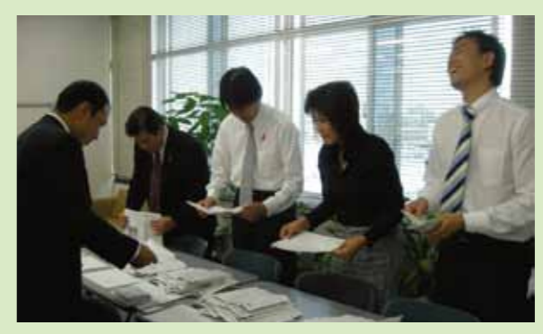
▲自民党市議団一同での市政アンケート集計

A 野川インターチェンジが計画された昭和62年と比べると、第三京浜道路を取り巻く交通環境などが、大きく変化している。広域的な視点を持つことが今後重要となってくる。幅広く検討する必要があることを踏まえて、東日本高速株式会社と調整していく。